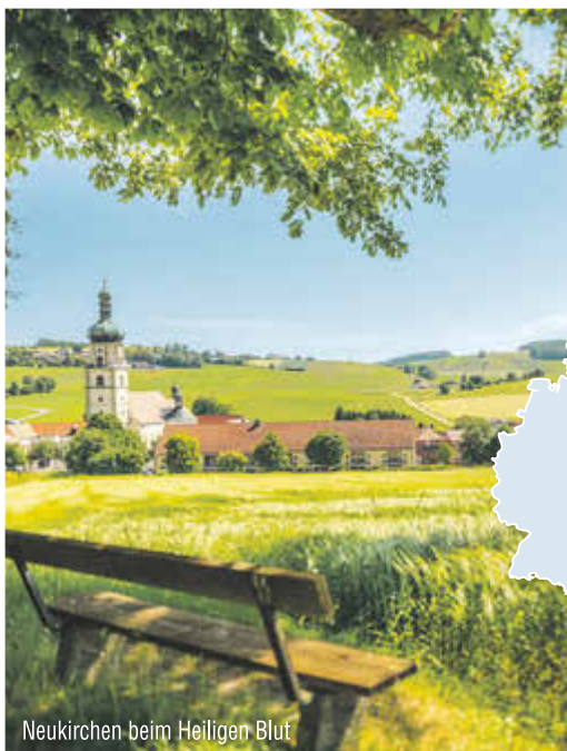
Neukirchen beim Heiligen Blut