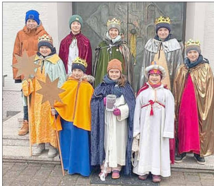
Sternsinger in Elschbach

Am 4. Januar waren in Elschbach die Sternsingerinnen und Sternsinger unterwegs. Sie zogen von Haus zu Haus, um den Neujahrsegen zu überbringen. Dabei sammelten sie 948,50 €.