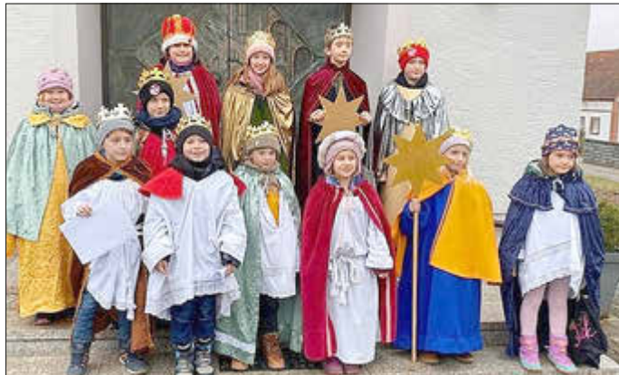
Sternsingen in Elschbach

Danke allen, die tatkräftig bei dieser segensreichen Aktion mitgewirkt haben.