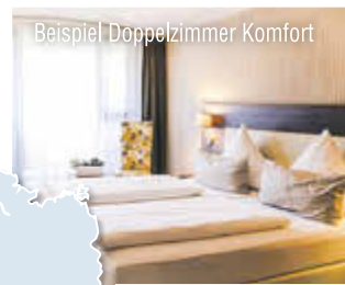
Beispiel Doppelzimmer Komfort