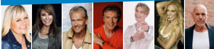
Gaby Baginsky, Ireen Sheer, Olaf Berger, Peter Orloff, Vincent Gross, Loona und Olaf Henning