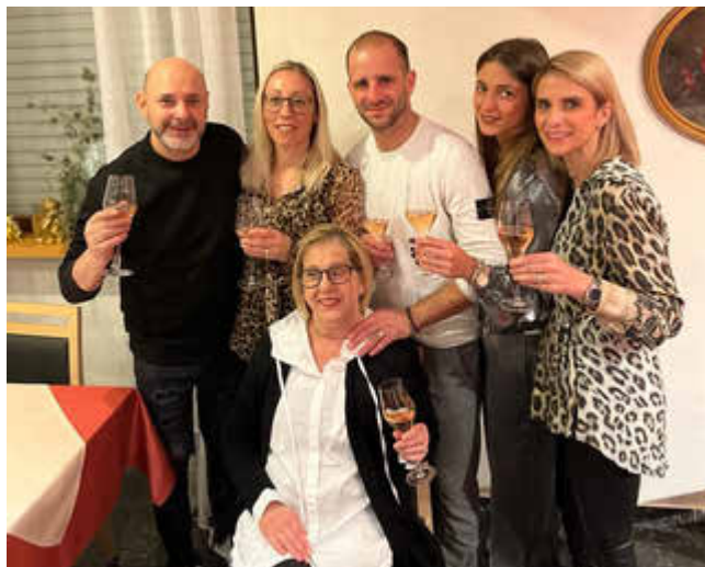
Pizzeria Da Paolo, Miesau

Nach über 40 Jahren schließen wir unseren Familienbetrieb Da Paolo. Wir möchten uns bei all unseren treuen Kunden für die vielen, tollen Jahre bedanken. Es war sehr schön mit euch.