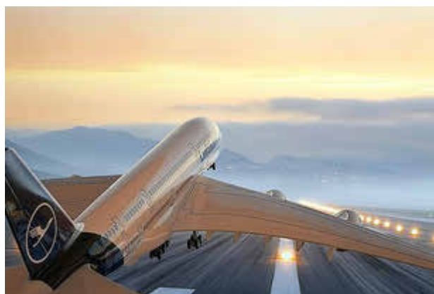
So entsteht ein Foto Flugzeugstart: