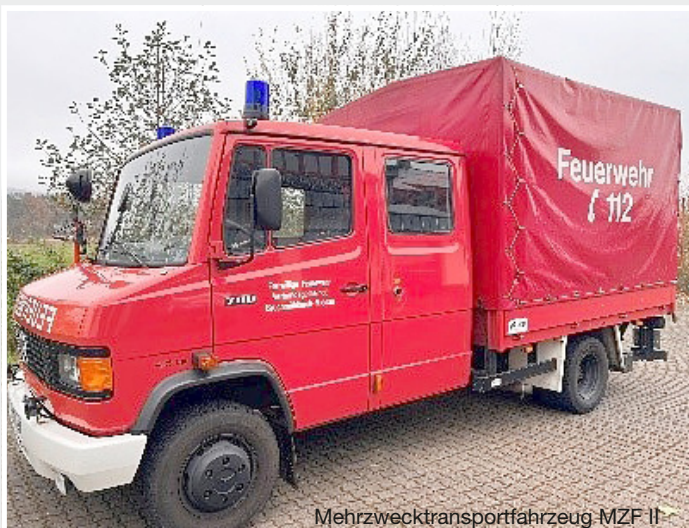
Mehrzwecktransportfahrzeug MZF II