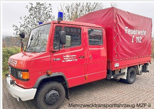
Mehrzwecktransportfahrzeug MZF II