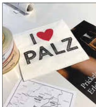
Das Motto der Veranstaltung war auch auf den Servietten zu lesen.

Das Publikum genoss außer der Musik, die pfälzischen Weine, das pfälzische Essen in der Pause (Saumaache, Brodworscht, Sauerkraut un Grumbeer-Schdambes).