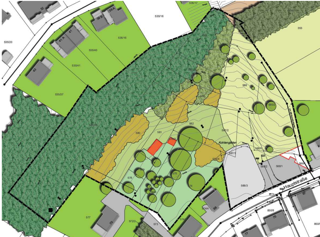
Abb. 1: Räumliche Übersicht (schwarz gestrichelt = Untersuchungsgebiet).

Das Untersuchungsgebiet zum B-Plan „Am Kirchberg“ befindet sich westwärts der Ortschaft Lamsborn, Verbandsgemeinde Bruchmühlbach-Miesau, gelegen und umfasst ca. 2,7 ha (Abbildung 1).