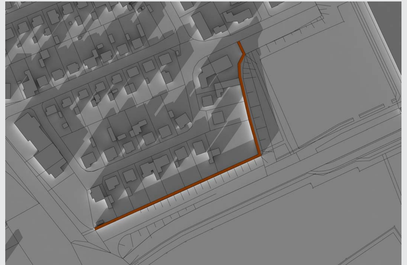
LÄRMSCHUTZWAND, H= 5,00 M