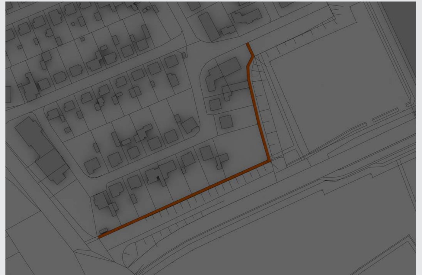
LÄRMSCHUTZWAND, H= 5,00 M