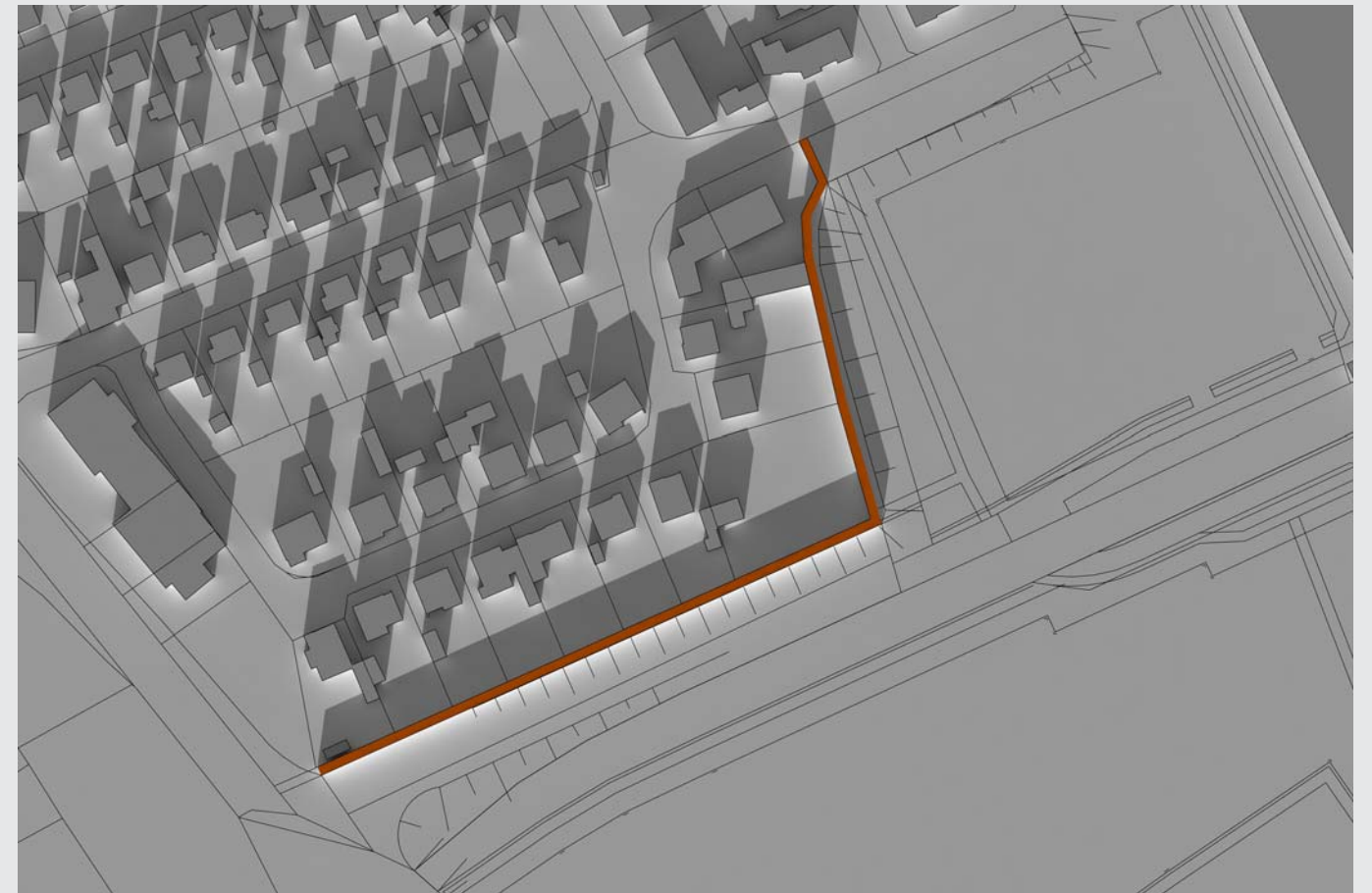
LÄRMSCHUTZWAND, H= 5,00 M